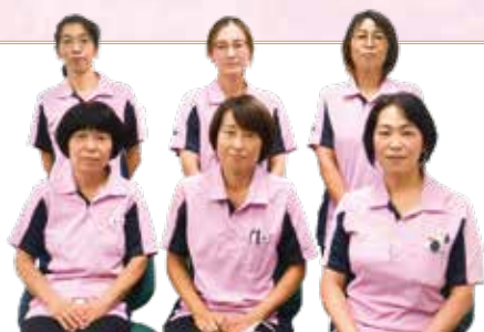
更生訪問看護ステーションの皆さん